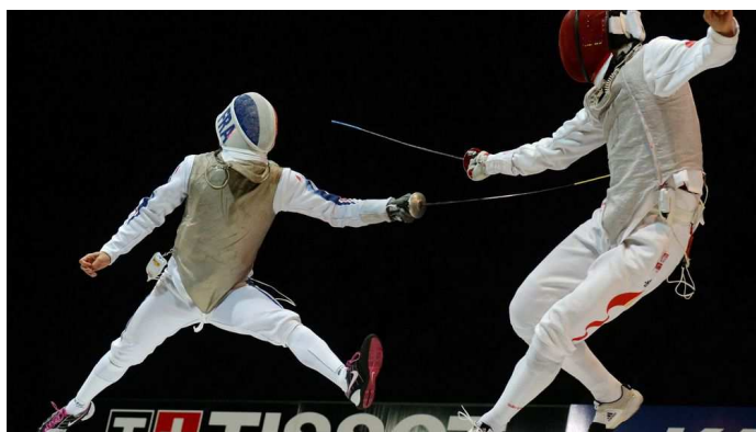
Phase de combat « normal » : pratique autorisée

Depuis le 22 Juin 2020, il est possible de reprendre les séances d'assaut en salle. Les seules restrictions à la pratique concernent le combat rapproché : corps à corps . Cette restriction n'a pas de réel impact sur la pratique pour les plus jeunes (catégorie M5 à M13) et ne constitue qu'un élément de jeu « marginal » en phase d'entraînement et d'apprentissage.