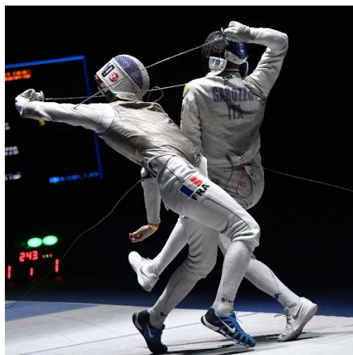
Phase de combat « rapproché » : pratique proscrite