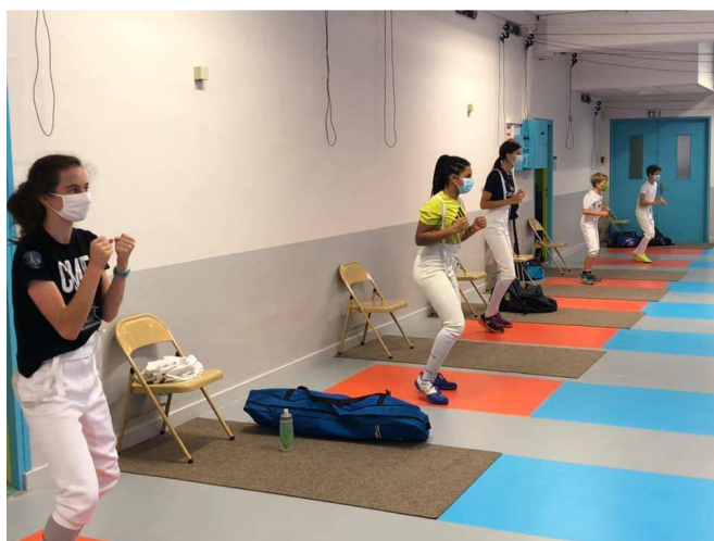
Port du masque à l'échauffement.

A la fin de l'activité le masque est remis.